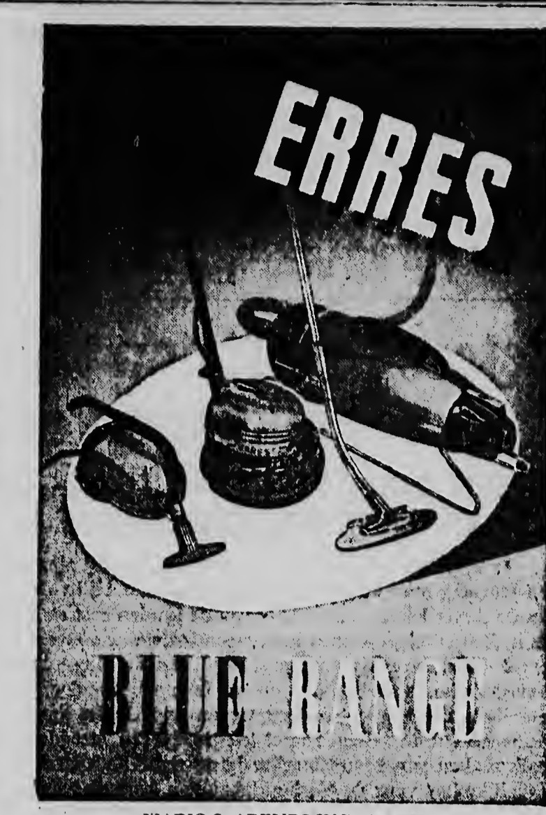
MARIO S. ARENDS INC., ARUBA